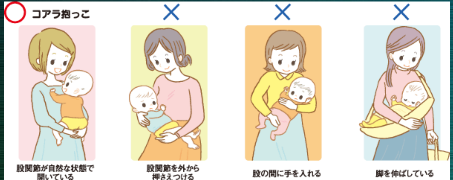
股関節が自然な状態で開いている